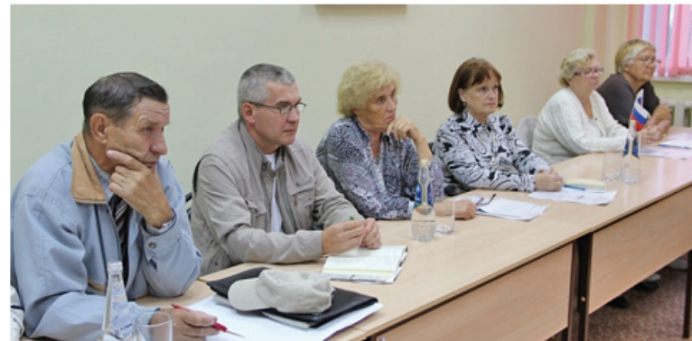
Председатели советов МКД переживают, что их деньги в фонде капремонта «съест» инфляция