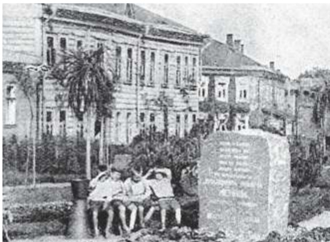
Памятный камень и сквер на месте покушения. 1923 год.