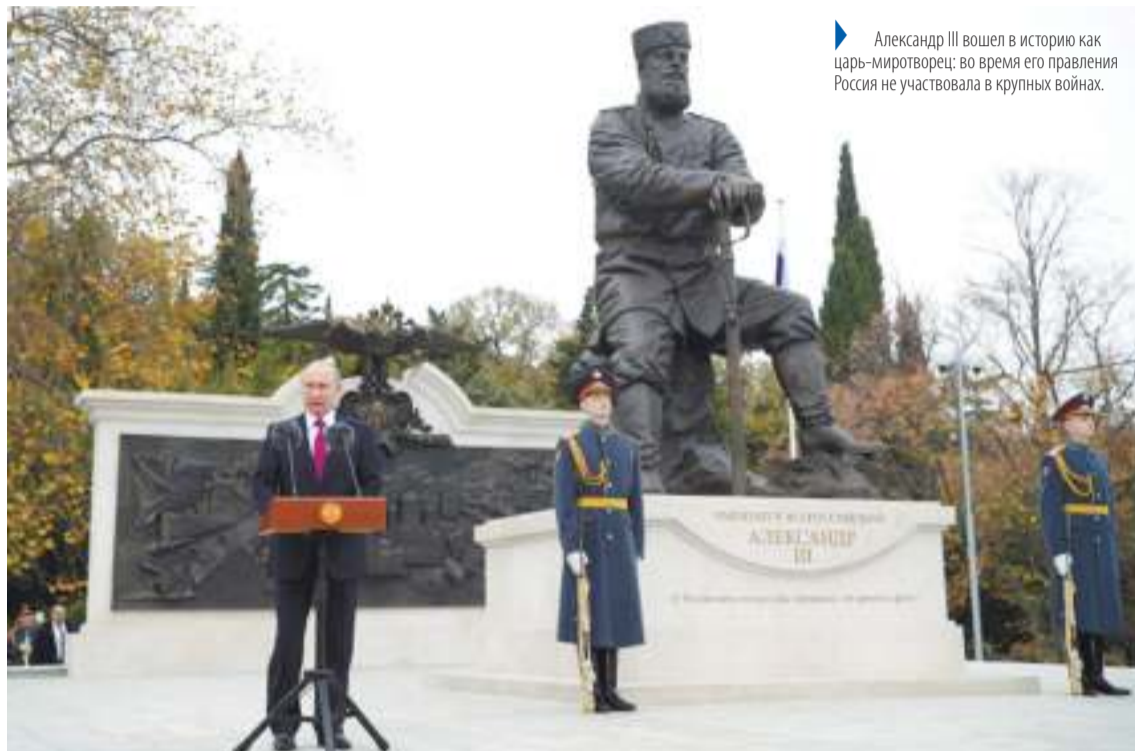
Александр III вошел в историю как царь-мироотворец: во время его правления Россия не участвовала в крупных войнах.

Президент перечислил сильные стороны правления императора: бурное промышленное развитие страны, прогрессивное для того времени трудовое законодательство, строительство Транссибирской магистрали. Отдельно подчеркнул, что при Александре III