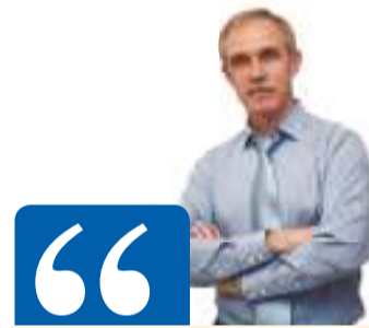
Сергей Морозов, губернатор Ульяновской области

- Эти средства являются очень хорошим подспорьем для проведения зрелой социальной политики. Кстати, напоминая, что эти средства были направлены на повышение зарплат, ремонт и гранты школам, модернизацию ЖКХ, социальные выплаты ветеранам