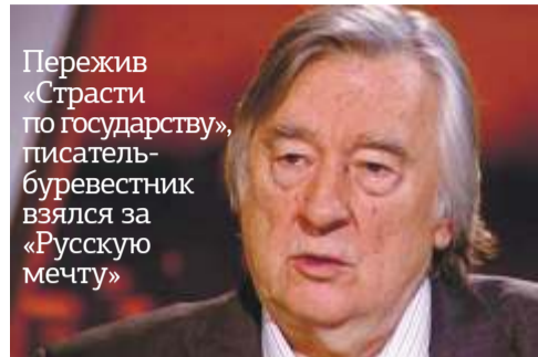
Пережив «Страсти по государству», писатель-буревестник взялся за «Русскую мечту»

Да, на месте предприятия, вошедшего в книги, живописные полотна, фильмы, поднимется квартал с квартирами, офисами и ландшафтным дизайном. Хорошо, что будут сохранены памятник заводчанам, погибшим в Великую Отечественную и в Афганистане. Хорошо, что не снесут статую Ленина и камень - памятный знак на месте, где вождя пытались убить. Все это - наша память. И совсем не инсценировка.