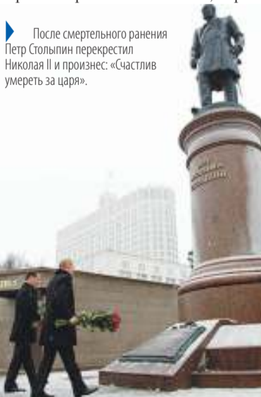
После смертельного ранения Петр Столыпин перекрестил Николая II и произнес: «Счастливы умереть за царя».

Сегодня вновь хочу сказать: Россия у нас одна. И все мы, каких бы разных взглядов и позиций ни придерживались, должны беречь и защищать ее, во главу угла ставить будущее нашего народа, счастье наших людей, наших детей и внуков.