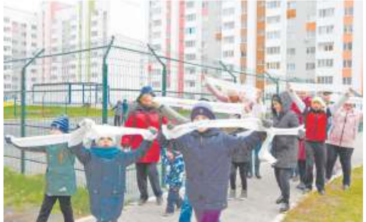
На ленточках написали имена для каждого нового дерева во дворе

Возможно, в программу 2019 года войдут меньше дворов, чем планируется. Это будет понятно после того, как по итогам обследования будет составлена проектно-сметная документация и определены лимиты финансирования. Встречи с жителями продолжатся, в том числе предстоит осмотреть и принять сделанное в этом году. Окончательно завершить благоустройство обещают в ноябре с установкой детских и спортивных площадок.