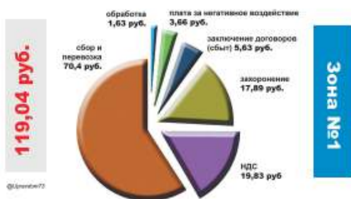
Из чего складывается тариф на вывоз ТКО