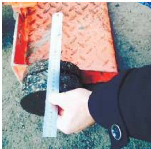
Лаборатория Департамента автомобильных дорог Ульяновской области провела проверку качества (отбор кернов) нового асфальта во дворах ТОС

Положительное отношение жителей - один из самых главных аспектов благоустройства. Без него невозможно будет поддерживать порядок. По словам рабочих, во время очистки сточной канавы они доставали оттуда разнообразные вещи, начиная от дырявых носков, бутылок, тряпок и до более крупных - старых колясок, автомобильных шин... Среди прочего были даже комод и шуба. Конечно, все это сюда не ветром занесло, хлам на протяжении многих лет кидали сами жители буквально возле собственных домов.