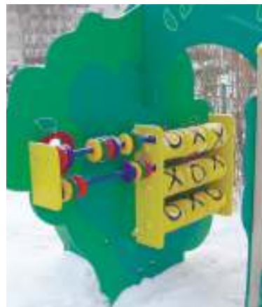
Дерево знаний - малыши тут учатся считать, читать и даже немного нотной грамоте

Кроме того, Галина ГОСТЕВАЯ ходила по другим дворам, смотрела, как происходит благоустройство там, какие тренажеры, какие спортивные и детские площадки ставят. Ведь лучше учиться на чужих ошибках!