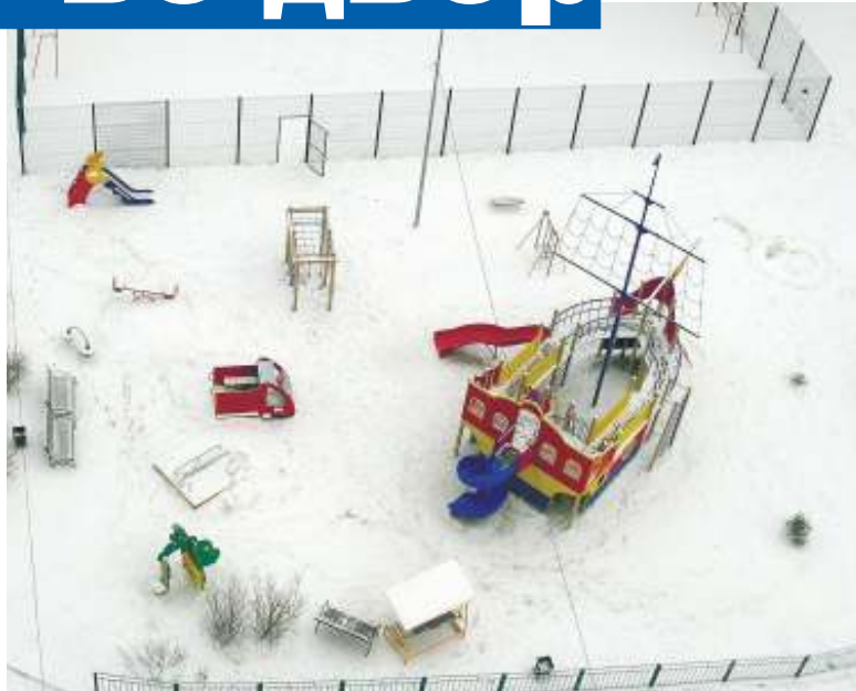
Вид на двор из окна старшей по дому - смотрела и мечтала, планировала и сделала!

- Депутат Игорь БУЛАНОВ нам много помогал. С его помощью мы несколько раз латали асфальт, где у нас лужа была. Только я поняла, что это бесполезно. В одном месте заделаешь, вода в другое место