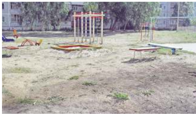
Состояние двора до благоустройства