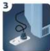
3 Подключите электропитание и включите телевизор