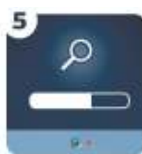
5 Произведите автоматический или ручной поиск цифровых телевизионных программ, используя инструкцию по эксплуатации

Получить консультацию по подключению к цифровому эфирному телевидению можно в Едином информационном центре по номеру 8-800-220-20-02 (звонок по России бесплатный)