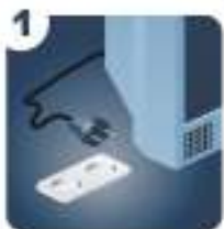
1 Отключите электропитание телевизора

Если на разных телевизорах вы хотите смотреть разные каналы, то необходимо приобрести приставку к каждому телевизионному приемнику.