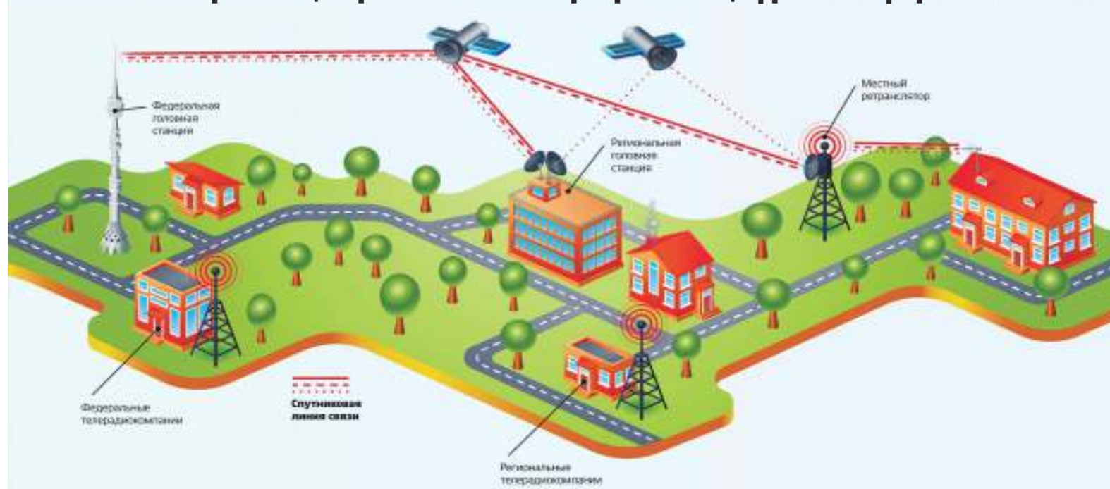
Схема трансляции региональных программ в цифровом эфирном ТВ

По оценкам федеральных экспертов, Ульяновская область и город Ульяновск готовы к окончательному переходу на цифровое ТВ и отказу от аналогового вещания.