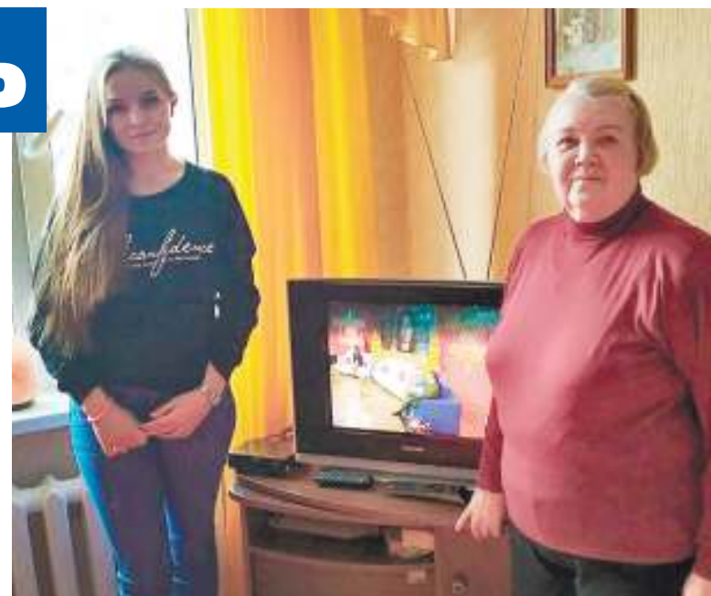
Волонтеры - студенты Ульяновского профессионально-педагогического колледжа - 29 января помогли четырем пожилым гражданам подключить приставки и настроить аналоговые телевизоры для приема цифрового сигнала