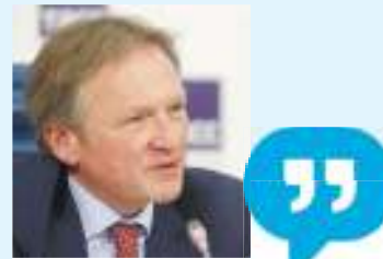
Бизнес-омбудсмен РФ Борис ТИТОВ:

Бизнес-омбудсмен РФ Борис ТИТОВ вынес тему на федеральный уровень. На пресс-кон-