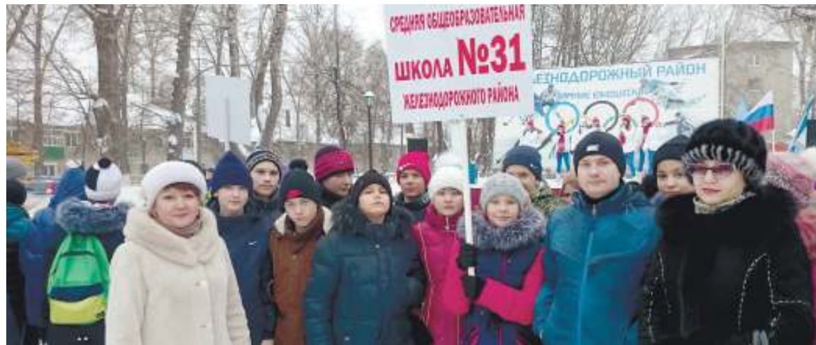
В прошлом году была капитально отремонтирована сама школа №31 и территория вокруг нее - большое событие для всех жителей округа