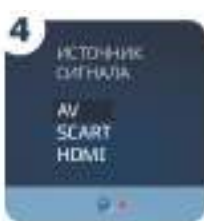
4 Выберите в меню телевизора источник входного сигнала: HDMI, AV, SCART или др.