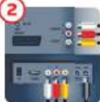
2 Подключите антенный кабель к антенному входу цифровой приставки. Подключите видео- и аудиокабель к соответствующим разъемам на телевизоре и цифровой приставке