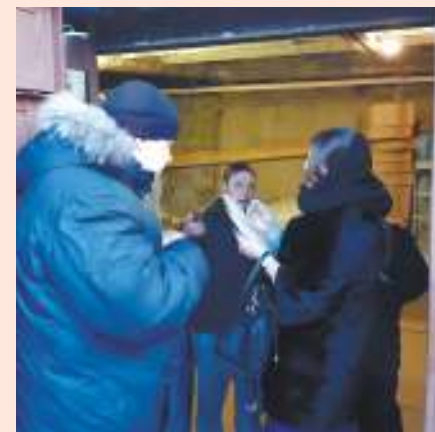
Инспекторы из Минприроды проверяют дымящие трубами гаражи, но вместо личного автотранспорта жителей там размещаются мебельные производства

В прошлом году с ноября по декабрь в связи с жалобами жителей Минприроды проводило рейдовые мероприятия. Было выявлено 46 случаев загрязнения воздуха (для сравнения за 2017 год - 15 нарушений). В результате 14 юридических, 20 должностных и 3 физических лица привлечены к административной ответственности по ст. 8.21 КоАП РФ. По этой статье наложено штрафных санкций на общую сумму 1 млн 663 тыс. рублей.