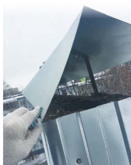
Изначально на вентиляционные каналы установили козырьки из такого тонкого металла, который, как бумага, развеялся на ветру - постоянный лязг не давал спать жильцам