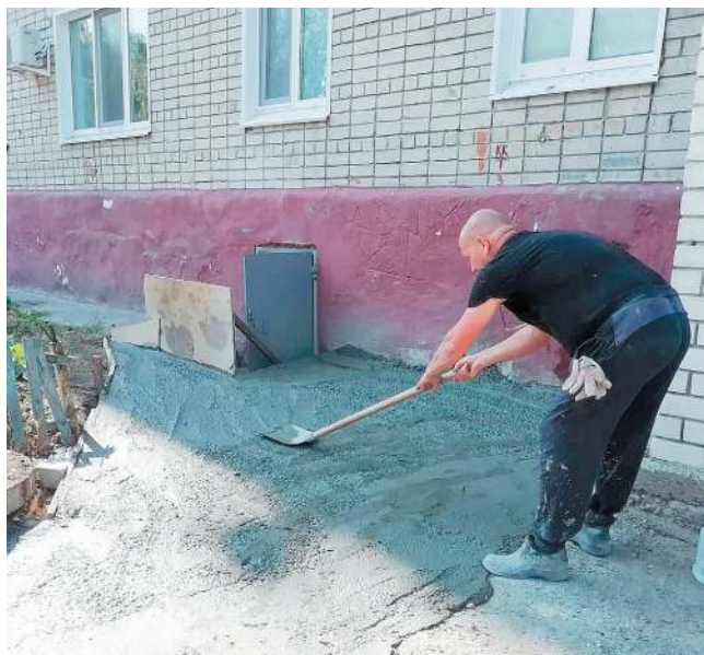
Отмостка - быстрее самому сделать

- Когда сюда переехал, поразилась, что, несмотря на мусоропровод, многие почему-то кидали свои отходы на входе в подъезд. Вон