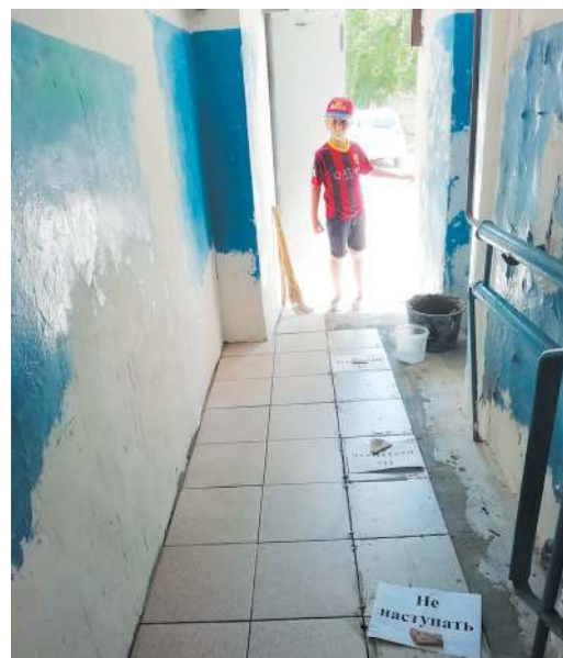
И ремонт в подъезде можно сделать без помощи УК

стояла жуткая! Мусорщику приходилось разгрести кучу, чтобы добраться до полупустого контейнера и выкатить его. Сейчас я все это дело огородил, запер на ключ, с людьми поговорил. Жители с первых этажей теперь благодарят: «Спасибо, наконец-то форточки можем открыть проветрить в квартире и вонь не чуем!». Теперь перестали наваливать отходы в кучи. Если случается, кто-то забывает, так я напоминаю. Для крупногабаритного мусора - отдельная площадка. Оказалось, можно же в чистоте-то свой дом содержать, если самим не мусорить! - поясняет старший по дому.