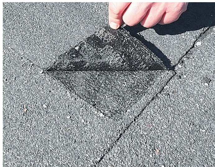
Слабая адгезия, проще говоря, никакого прилипание, наблюдается по всей кровле после проведенного так называемого «капитального» ремонта стоимостью более 1,5 млн рублей