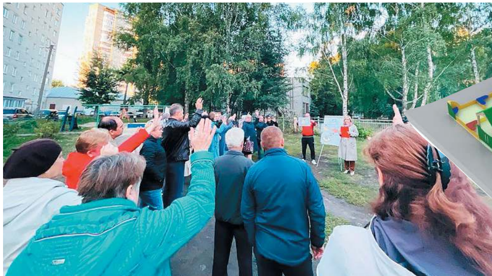
Жильцы проголосовали за участие в региональной программе, которая поможет им благоустроить двор за счет бюджета

Алексей Николаев Фото автора и Сергея Горшкова