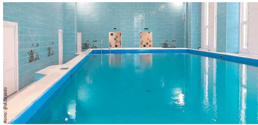
Малый бассейн в СК «Торпедо»

Готова к открытию малая чаша в «Торпедо» размером 6 на 12,5 метра. Сейчас здесь идет техническая приемка объекта. Напомним, мы уже рассказывали об этом проекте, который создается специально для обучения плаванию малышей в возрасте до 6 лет. Работы провели всего за 8 месяцев. Не только построено здание и сам бассейн с душевыми, раздевалкой и всеми необходимыми помещениями, но и проведено благоустройство прилегающей территории вокруг. Занятиями по плаванию теперь будут охвачены все возрастные группы населения и даже самые маленькие ульяновцы!