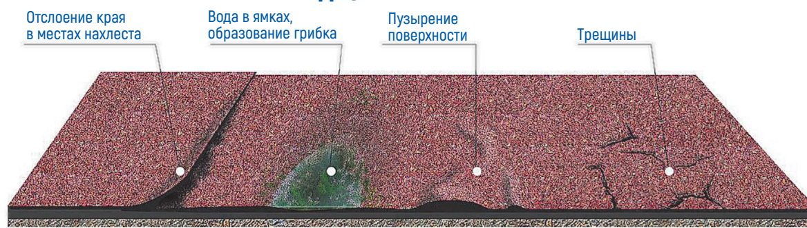
Эти признаки помогут выявить некачественный ремонт крыши при осмотре и приемке работ