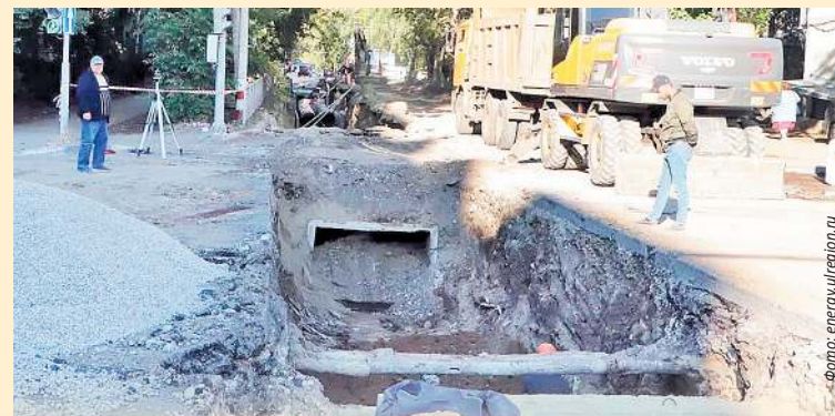
При раскопке ул. Ефремова тепловики обнаружили, что их сети тесно сплелись с большим количеством смежных коммуникаций, в том числе от Ульяновскводоканала. Приходится почти ювелирно обходить чужие трубы, чтобы не нарушить обеспечение жителей коммунальными услугами. Несмотря на сложность, обещают выполнить все работы в срок

В рамках подготовки к зиме ульяновские энергетики обновляют более 28 км тепловых сетей. Из них около 12 км - это капитальный ремонт, производимый муниципальными предприятиями «Городская теплосеть», «Городской теплосервис» и «Теплоком». Еще более 16 км - модернизация сетей, то есть увеличение диаметра и замена обычных металлических труб на современные, изолированные от коррозии, - проведет ульяновский филиал ПАО «Т Плюс». В настоящее время продолжают раскопки на ул. Ефремова, Московском шоссе и возле мемцентра. Однако, по заверениям энергетиков, продолжающийся ремонт сетей не мешает начать отопительный сезон вовремя, так как подача тепла будет осуществляться по обходным и резервным маршрутам.