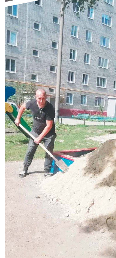
Песочницу сам сколотил, покрасил, самому и песок в нее завозить