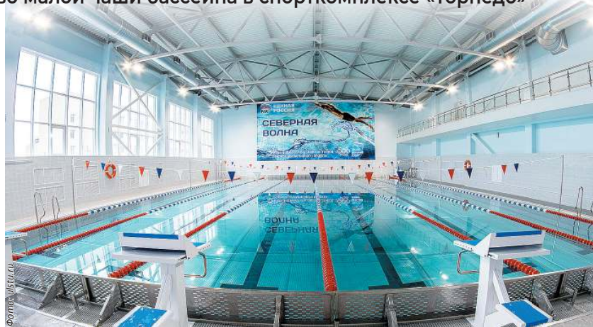
«Северная волна» в УлГТУ

- ФОК с бассейном «Северная волна» стал частью социальной и спортивной инфраструктуры Ульяновского госу-