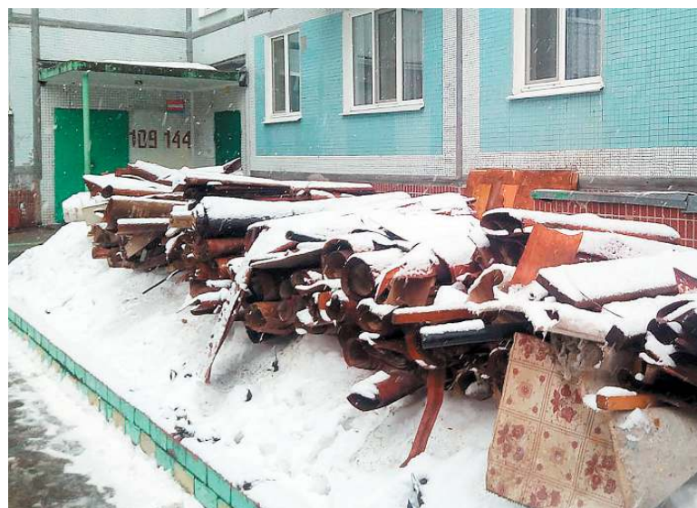
Что это - КГО или строительный мусор? Кто его разберет! Но вот поменяли полы в квартире, а старый линолеум выложили на газон. Почему теперь все в доме должны этим «любоваться»? Уважайте соседей, уберите за собой, договоритесь с регоператором или УК, вы же не просто кулек с мусором выкинули, а целый грузовик отходов

При этом в Правилах №1156 дается следующая расшифровка: «крупногабаритные отходы» - это мебель, бытовая техника, отходы от текущего ремонта жилых помещений и другое. Как жильцу МКД понять, что у него именно капитальный, а не текущий ремонт, и отходы не крупногабаритные, а строительные?! Вряд ли многие зачитываются ФККО. Да и те, кто изучал документы, не всегда могут четко сформулировать и ответить на этот вопрос: когда КГО - это уже строительный мусор? Все это создает благодатную почву для конфликтов. Тем временем кучи копятся возле подъездов, регоператор не увозит, считая отходы не своими, УК тоже не увозит, настаивая на дополнительной оплате с собственников, проводивших ремонт, те не соглашаются... А остальные ходят и спотыкаются о мусор.