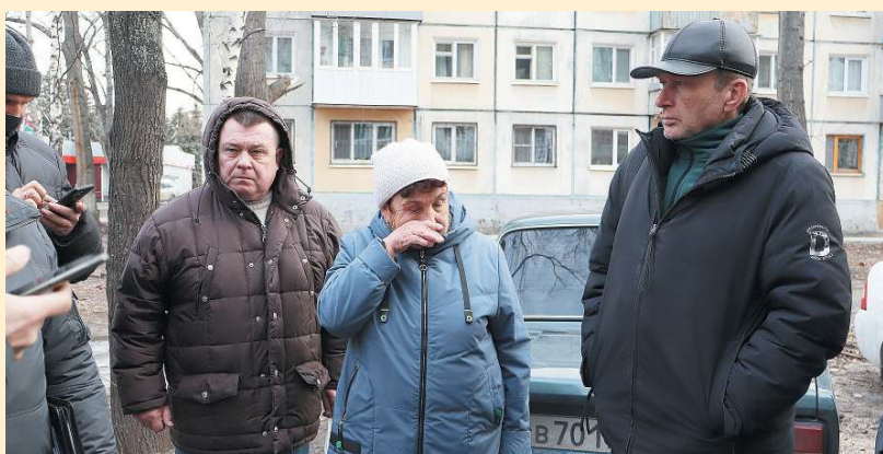
Жительница буквально со слезами на глазах рассказывала о своих бедах с трубой депутатам и энергетикам