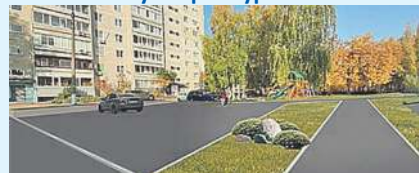
Территория у СК «Олимп»