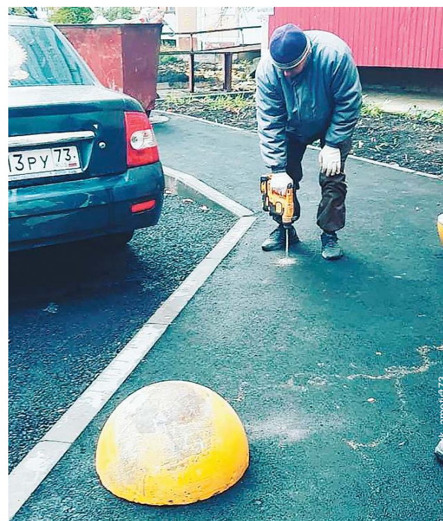
Самым надежным способом борьбы с незаконной парковкой во дворе остаются всевозможные декоративные ограждения и самые доступные - полусферы.