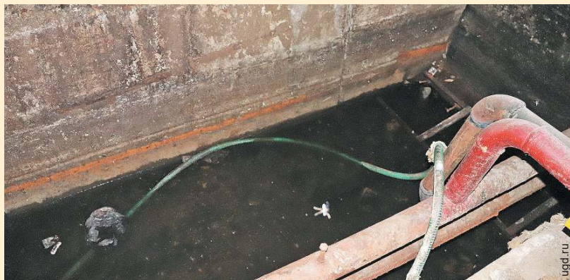
Тоннель под домом практически всегда заполнен, иногда и переливается через край, а зимой парит, как из термальных источников

Жители дома №79 на Московском шоссе уже не могут выносить вонь из подвала. Сюда стекаются канализационные стоки с трех МКД и фактически варятся в системе отопления.