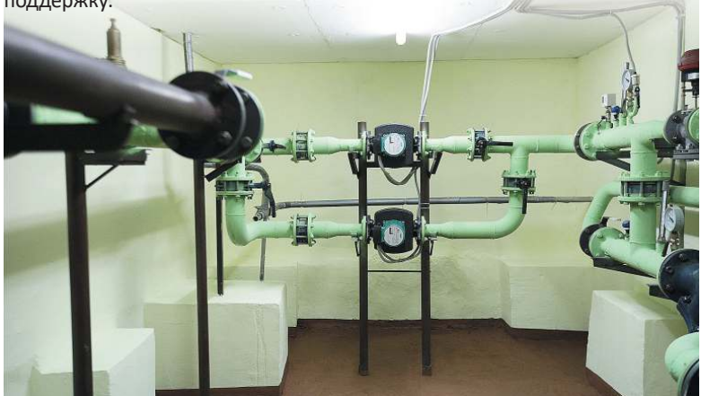
Чисто, сухо и светло - нечасто можно увидеть такой образцовый порядок в подвале МКД старше 35 лет

Полученная же из бюджета компенсация была направлена собственниками МКД на ремонт крыши и межпанельных швов. В доме стало еще теплее и комфортнее. Плюс к этому, как отметил Глава Ульяновска, в прошлом году во дворе Корунковой, д. 12 произведена замена асфальтового покрытия тротуаров и проездов, организованы дополнительные парковочные места, установлен новый бортовой камень. Благоустройство было выполнено за счет федерального проекта «Формирование комфортной городской среды».