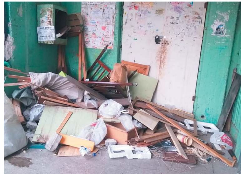
КРУПНОГАБАРИТНЫЕ ОТХОДЫ образуются в жилых помещениях в процессе потребления физическими лицами, а также товары, утратившие свои потребительские свойства в процессе их использования в жилых помещениях в целях удовлетворения личных и бытовых нужд (ст. 1 Федерального закона от 24.06.1998 №89-ФЗ «Об отходах производства и потребления»)