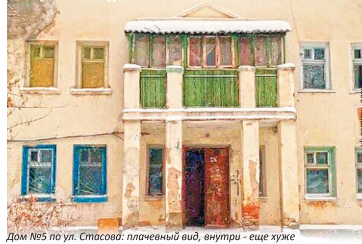
Дом №5 по ул. Стасова: плачевный вид, внутри - еще хуже