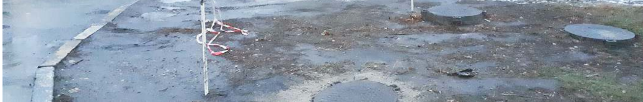
Вот такое наплевательское отношение к газонам демонстрируют отдельные жильцы дома №20 по ул. Кирова. Это приводит не только к тому, что ломаются и проваливаются люки технических колодцев, но и к тому, что по всему двору с колес авто размазывается грязь. Неужели людям самим приятно смотреть на «свинарник» у себя под окнами?!

Верховный суд также разъяснил и то обстоятельство, что понятие «газон» отсутствует в ПДД. Ничего страшного: если нет в федеральном законе, пропишут в региональном! В пункте 17 постановления Пленума Верховного суда РФ от 25 июня 2019 года №20 говорится, что, если остановка или стоянка транспортного средства была осуществлена на территориях, на которые не распространяется действие раздела 12 ПДД (например, газон, детская площадка, иные объекты благоустройства), то административная ответственность за указанные нарушения может быть установлена законами субъектов Российской Федерации.