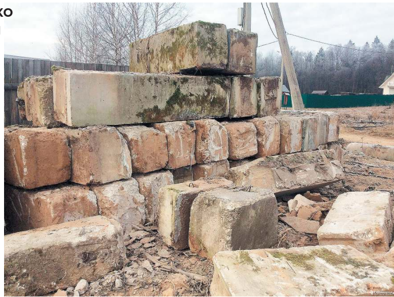
СТРОИТЕЛЬНЫЙ МУСОР - это отходы, которые образуются в процессе строительной деятельности организаций, имеющих соответствующие лицензии для выполнения таких работ (Приказ №511 от 15.06.2001 года Министерства природных ресурсов РФ)

- Действительно, по закону так не положено, но так сложилось, что в большинстве дворов отсутствуют бункеры или специальные площадки для КГО. По идее, устанавливать и строить их должен собственник земельного участка, чаще всего это муниципалитет. А пока люди либо стаскивают крупногабаритные отходы к контейнерной площадке, либо выставляют возле подъезда. Мусоровоз не может их забрать, так как они в него не помещаются. Мы отдельно высылаем грузовик, но не каждый день, а раз в неделю либо по заявке. И пока эти крупногабаритные отходы лежат, создается впечатление, что образовалась свалка. Если бы все было как написано в законе, такого бы не было, но в реальности все иначе, - прокомментировал зам-