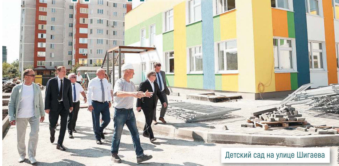
Детский сад на улице Шигаева