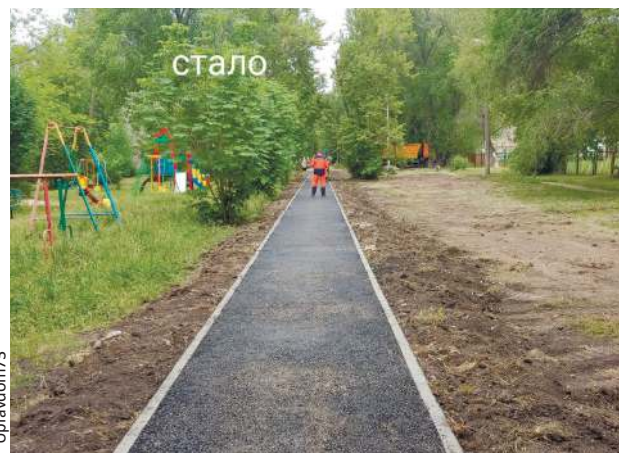
Народная тропа за школой №39 стала наконец полноценным тротуаром, жители целого микрорайона вздохнули с облегчением