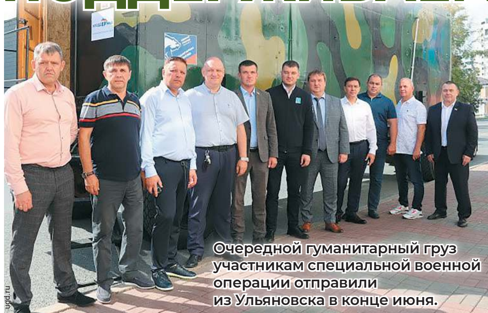
Очередной гуманитарный груз участникам специальной военной операции отправили из Ульяновска в конце июня.