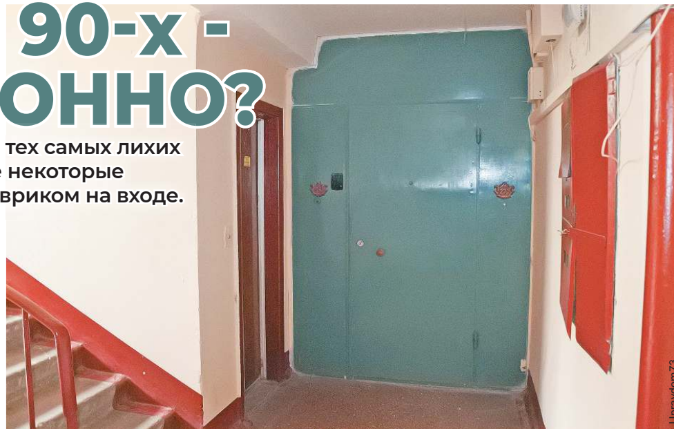
Раньше (во времена разгула после распада СССР) таким образом люди защищались от непрошенных гостей, дополнительная перегородка ограждала от того, чтобы не ломались в дверь квартиры